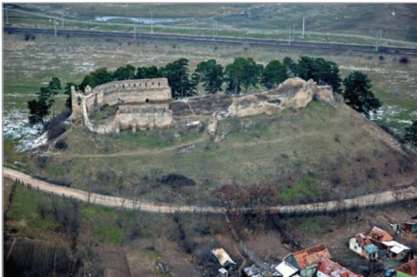
A földvári vár helyreállítás előtti látképe délről, 2010 márciusában

nyomaira bukkantak; ezek a későbbi monostor, majd a keleti torony építésekor jóformán teljesen elpusztultak. A régészek feltételezik továbbá, hogy a lovagrendi építkezések során előkészítő földmunkák történtek a vár közepén később emelt templom helyén, valamint a nyugati torony környezetében, sőt talán ezek építése is elkezdődött. A lovagok kővára a 14. század elején már biztosan romokban volt (a fal omladékán I. Károly király 1327-ben vert pénze került elő). A lovagrendi erődítmény rövid fennállásának idejéből származó legfontosabb leleteket – köztük két 13. századi sarkantyút – jelenleg a brassói városfalhoz tartozó Graft-bástyában 2019-ben megnyílt kiállításon tekinthetik meg az érdeklődők.