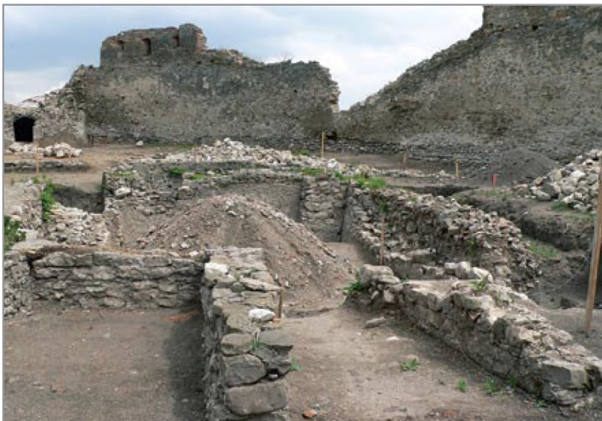
A 13. századi eredetű kápolna feltárása 2013 májusában