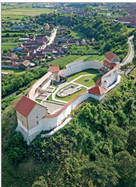
A helyreállított erősség északkeletről