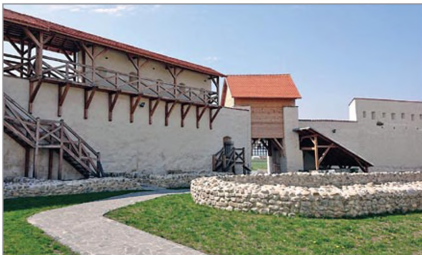
A belső kaputorony és a gyilokjáróval ellátott déli várfal a kápolna romja felől