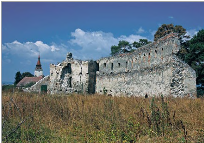
A nyugati torony és az északnyugati várfal romja 2012 nyarán, a háttérben a község temploma látható

tőle keletre felépített monostorépületek romjait 2013-tól maradéktalanul feltárták, a falmaradványokat konzerválták.