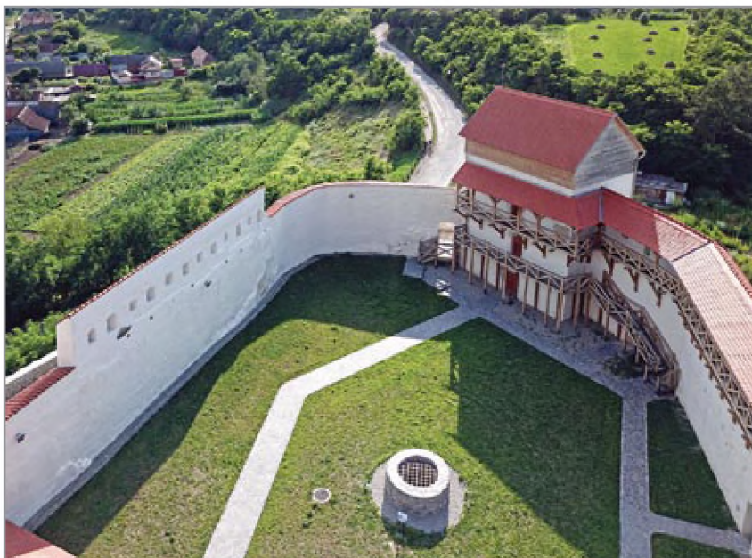
A nyugati torony, az északi várfal a gyilokjáróval és a kút a helyreállítást követően

további alapfalat építettek. A templom nyugati falát lebontották, helyette szűk pincelejárat és kiegészítő falazat készült. A keleti oldalon a diadalív vonalában fallal választották el a hajót a szentélytől. Az egykori félkörzáródású szentély területének jobb felhasználása érdekében az íves keleti szentélyzáródást úgy egészítették ki, hogy ezen az oldalon is sík falfelületet hoztak létre. Az ásatást követő helyreállítás során az elpusztult nyugati templomfalat annak feltételezett helyén rekonstruálták.